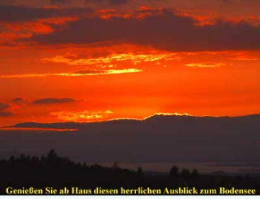
Genießen Sie ab Haus diesen herrlichen Ausblick zum Bodensee