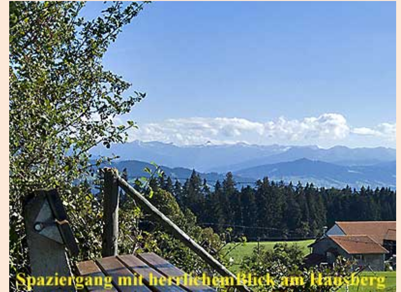
Spaziergang mit herrlichem Blick am Hausberg

In Scheidegg leben etwa 4200 Menschen. Die Marktgemeinde mit ihren Kliniken, Hotels, Pensionen, Ferienwohnungen und Privatzimmern ist einer der wichtigsten Kur- und Tourismusorte im Westallgäu und trägt mehrere Auszeichnungen: So darf sich Scheidegg „Kneippkurort Premium-Class“, „Heilklimatischer Kurort Premium-Class“ sowie „Wellvital-Ort in Bayern“ nennen.